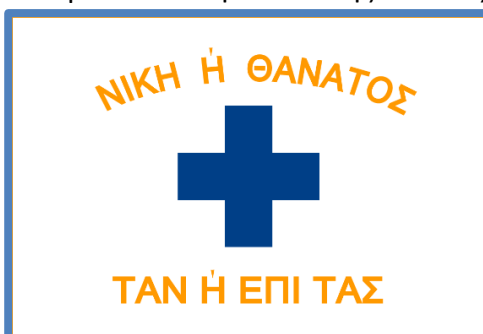
Σημαία των Μανιατών.

Αυτό το επεισόδιο (που συνιστά και ένα «Τραύμα» για την ελληνική εθνική συνείδηση) σημειώνει την αρχή της Τουρκοκρατίας (την περίοδο της οθωμανικής κυριαρχίας στην Ελλάδα), και είναι επίσης ένα πολύ σημαντικό γεγονός για την επιβεβαίωση του «Μύθου» της Θυσίας. Ακόμη μια φορά, οι ηρωικοί υπερασπιστές είχαν δώσει την ζωή τους για την προστασία της Πατρίδας. Το θέμα της Θυσίας υιοθετήθηκε μετέπειτα από τους Έλληνες πατριώτες τον 19 ο αιώνα, που οδήγησαν την Επανάσταση του 1821. Για παράδειγμα, το απόφθεγμα «ἢ τὰν ἢ ἐπὶ τᾶς» ήταν γραμμένο στις σημαίες τους συνάμα με το « Νίκη ἢ Θάνατος ». Ένα παρόμοιο παράδειγμα είναι το “ Ελευθεριά ἢ Θάνατος ”, το οποίο εξακολουθεί να είναι το εθνικό σύνθημα της Ελλάδας. Όλα αυτά μαζί ενσαρκώνουν την ιδέα της Θυσίας. Ακόμη, ο Θούριος του Ρήγα , ένα δημοφιλές πατριωτικό