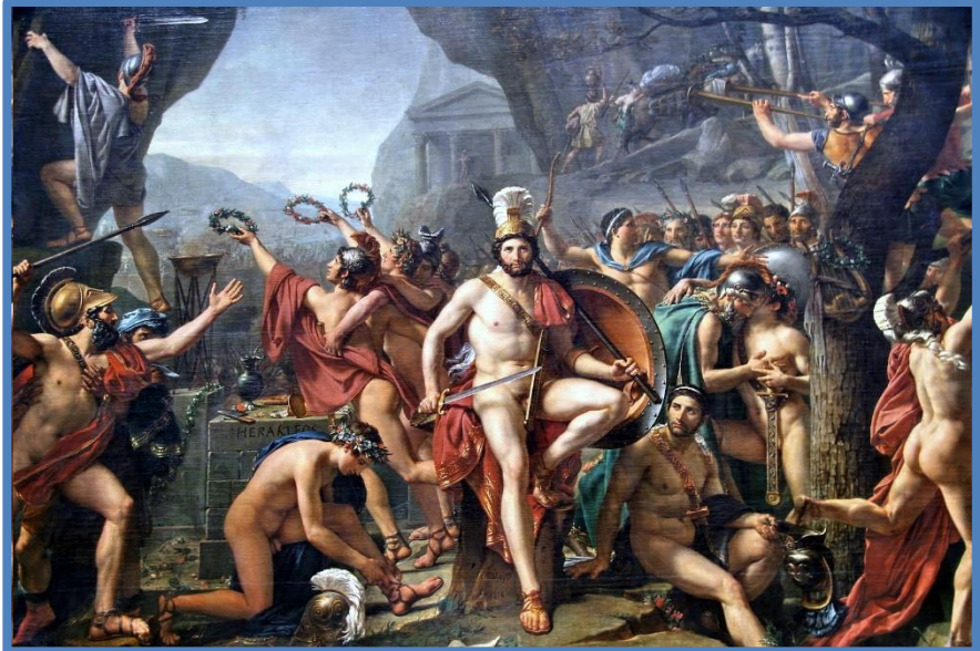
Ο Λεωνίδας στις Θερμοπύλες. Πίνακας του Jacques-Louis David.

πολεμιστές του στις Θερμοπύλες. Πριν από την αρχή της μάχης, ο Ξέρξης τους ζήτησε να παραδώσουν τα όπλα τους. Η απάντηση του Λεωνίδα είναι διάσημη: « Μολών λαβέ », ελάτε να τα πάρετε. Οι Έλληνες πολέμησαν για τρεις μέρες, και η μάχη τελείωσε μόνο όταν οι τελευταίοι άνδρες που είχαν παραμείνει στις Θερμοπύλες πέθαναν όλοι. Πιθανώς, αυτή είναι η πιο γνωστή θυσία της Ιστορίας στον πόλεμο, που θα γίνει ο βασικός «Μύθος» όχι μόνο για την Ελλάδα, αλλά για ολόκληρο τον Δυτικό Πολιτισμό.