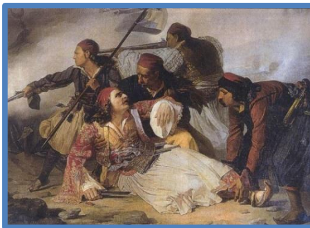
Ο θάνατος του Μ. Μπότσαρη. Πίνακας του Ludovico Lipparini.

τραγούδι, εξυμνεί τον ίδιο θέμα: « Κάλλιο είναι μιας ώρας ελεύθερη ζωή, παρά σαράντα χρόνια σκλαβιά και φυλακή ». Επίσης τα έργα ζωγραφικής που υπενθυμίζουν