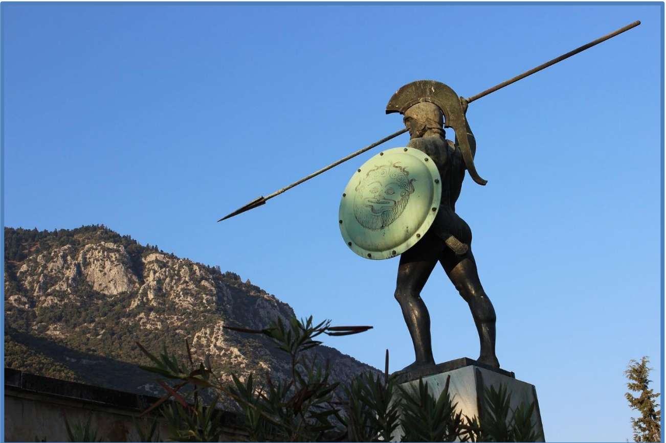
Το άγαλμα του Λεωνίδα στις Θερμοπύλες