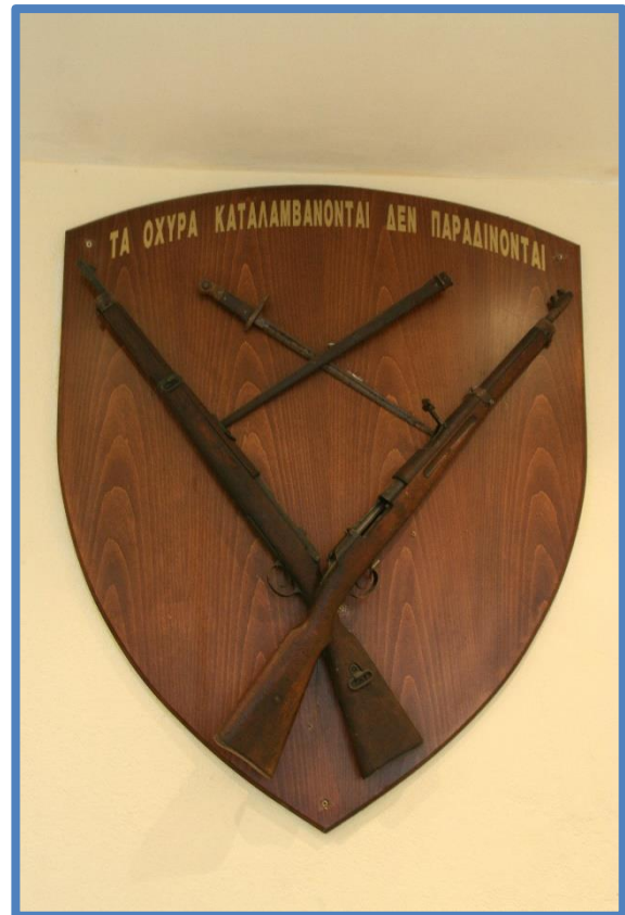
Μουσείο Οχυρό Ρούπελ: Έμβλημα με τα λόγια «τα οχηρά καταλαμβάνονται δεν παραδίδονται».

Αυτά τα γεγονότα του Β' Παγκοσμίου Πόλεμου σημάδεψαν το εθνικό πνεύμα των Ελλήνων. Η 28η Οκτωβρίου (επέτειος του «Όχι») είναι εθνική γιορτή στην Ελλάδα, αναδεικνύοντας την σπουδαιότητα του επεισοδίου. Η απάντηση του Μεταξά, η μάχη του Ρούπελ και η αντίσταση εναντίον των Γερμανών είναι αναπόσπαστα μέρη του «Μύθου» της Θυσίας. Αλλά, δεν είναι και οι τελευταίες εκδηλώσεις του.