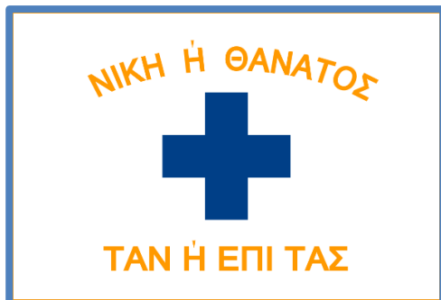
Σημαία των Μανιατών.

Αυτό το επεισόδιο (που συνιστά και ένα «Τραύμα» για την ελληνική εθνική συνείδηση) σημειώνει την αρχή της Τουρκοκρατίας (την περίοδο της οθωμανικής κυριαρχίας στην Ελλάδα), και είναι επίσης ένα πολύ σημαντικό γεγονός για την επιβεβαίωση του «Μύθου» της Θυσίας. Ακόμη μια φορά, οι ηρωικοί υπερασπιστές είχαν δώσει την ζωή τους για την προστασία της Πατρίδας. Το θέμα της Θυσίας υιοθετήθηκε μετέπειτα από τους Έλληνες πατριώτες τον 19 ο αιώνα, που οδήγησαν την Επανάσταση του 1821. Για παράδειγμα, το απόφθεγμα «ἢ τὰν ἢ ἐπὶ τᾶς» ήταν γραμμένο στις σημαίες τους συνάμα με το « Νίκη ἢ Θάνατος ». Ένα παρόμοιο παράδειγμα είναι το “ Ελευθεριά ἢ Θάνατος ”, το οποίο εξακολουθεί να είναι το εθνικό σύνθημα της Ελλάδας. Όλα αυτά μαζί ενσαρκώνουν την ιδέα της Θυσίας. Ακόμη, ο Θούριος του Ρήγα , ένα δημοφιλές πατριωτικό